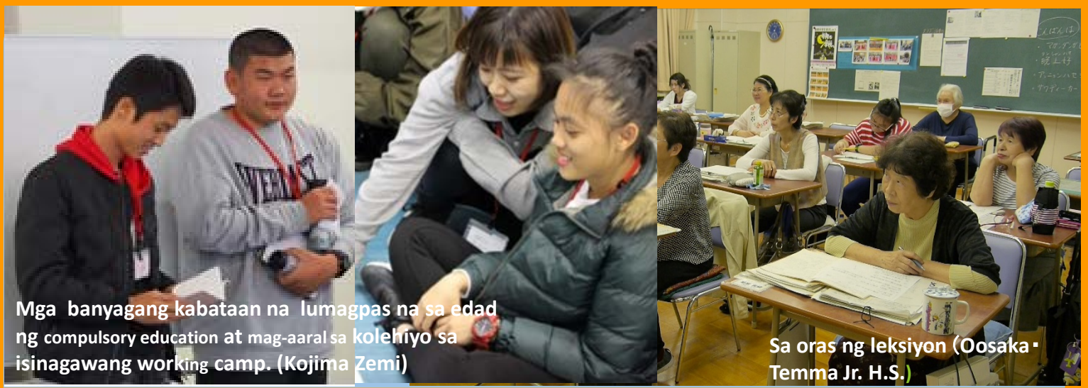
Mga banyagang kabataan na lumagpas na sa edad ng compulsory education at mag-aaral sa kolehiyo sa isinagawang working camp. (Kojima Zemi)